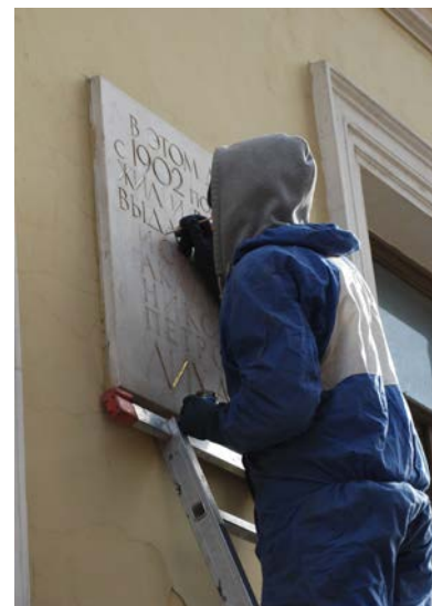
После окончания работ.